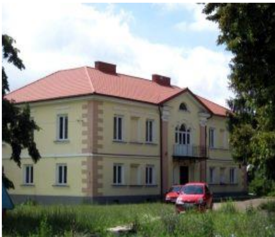
Ryc. 1. Złozenie pałacowo-parkowe w Kręgach.

Mimo tak niewielkiej liczby zabytków mieszkańcy kultywują swoje tradycje w inny sposób, zachowując dzięki temu dziedzictwo kulturowe.