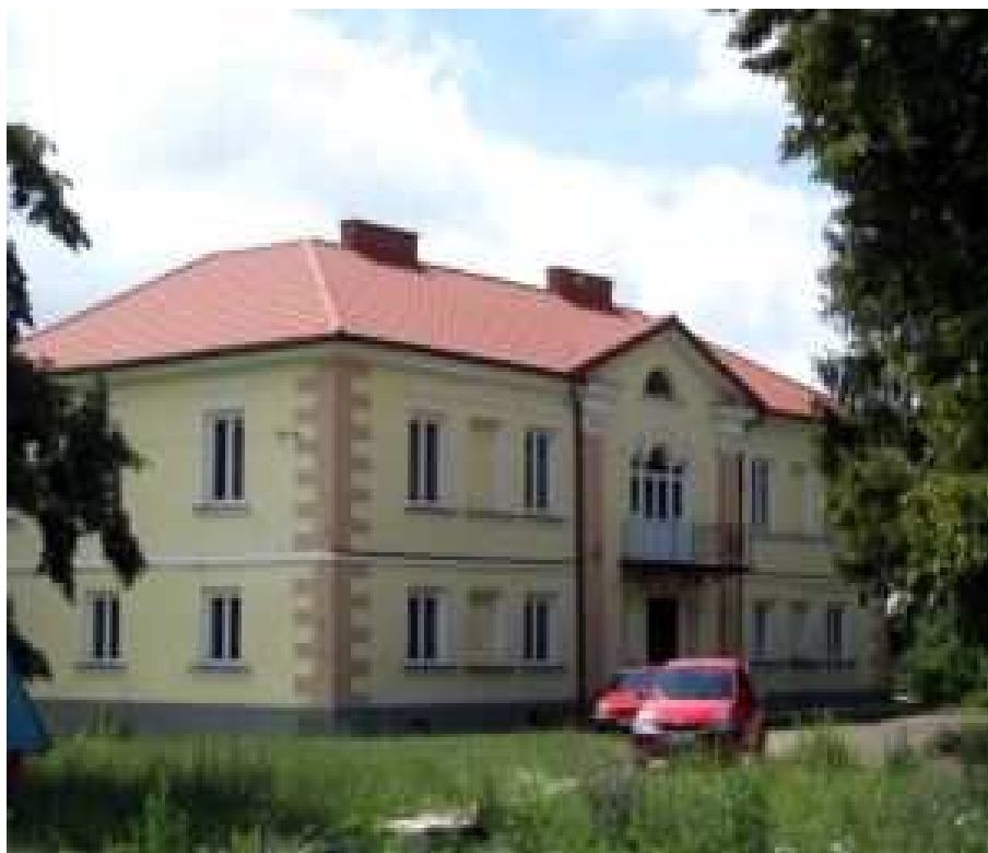
Ryc. 1. Złozenie pałacowo-parkowe w Kręgach.

Mimo tak niewielkiej liczby zabytków mieszkańcy kultywują swoje tradycje w inny sposób, zachowując dzięki temu dziedzictwo kulturowe.