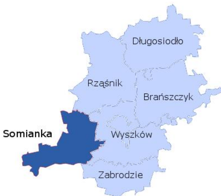
Rysunek 1 - Mapa powiatu wyszkowskiego

Powierzchnia gminy wynosi 117,8387 km 2 . W strukturze użytkowania obszaru gminy Somianka największy udział mają użytki rolne zajmujące ok. 8.603,5815 ha. Wśród użytków rolnych dominują grunty orne, zajmujące ok. 7.092,337 ha oraz łąki 432,2973 ha, sady to 129,2311 ha i pastwiska 949,7194 ha, pozostałe grunty to 1.152,8730 ha. Grunty pod lasami i zadrzewione zajmują 2.027,4142 ha. Lesistość gminy kształtuje się na poziomie 17,20%.